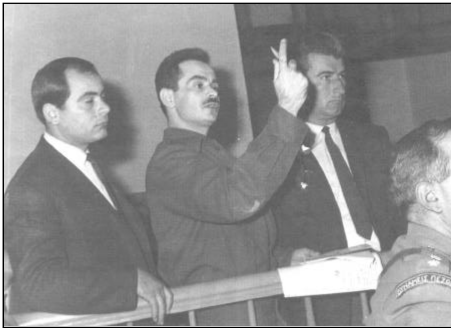
Στις 13 Αυγούστου 1968, ο Αλέκος Παναγούλης επιχειρεί να δολοφονήσει τον Γ. Παπαδόπουλο. Συλλαμβάνεται και βασανίζεται. Στις 18 Νοέμβρη, καταδικάζεται «δεις εις θάνατον» από το Έκτακτο Στρατοδικείο Αθηνών. Τελικά, η ποινή μετατρέπεται σε ισόβια. Μαζί του καταδικάζονται σε διάφορες ποινές και άλλα 10 μέλη της οργάνωσης «Δημοκρατική Αντίσταση».